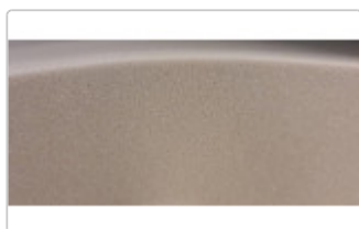
Schalldämmung mit unserem Ester Schaumstoff

Diese Schaumstoffe werden üblicherweise zur Schalldämmung und Lärmdämmung eingesetzt. Die Platten haben ein hohes Gewicht von ca. 35 Kg / m 3 (Kubikmeter), sind vollflexibel und dämmen damit Lärm effektiv. Egal ob Sie Lärm, den Sie verursachen, nach außen dämmen wollen, oder aber Lärm, der z.B. vom Nebenraum kommt, abhalten wollen. Auch Maschinen, Motoren, Pumpen, Kompressoren usw. können damit sehr gut gedämmt werden. Wichtig: Je dicker Sie den Schaumstoff anwenden, umso besser wird die Dämmung allgemein auch sein - vor allem auch niedrige Frequenzen bzw. tiefe Töne können mit dickerem Schaumstoff besser absorbiert werden. Im Folgenden listen wir Ihnen nur vorab die Daten dieses Schaumstoffs auf. Weiter unten finden Sie dann noch detaillierte Informationen zum Thema "Schalldämmung" mit vielen nützlichen Tipps und Links zu Anwendungsfällen, damit Ihnen die Auswahl leichter fällt und Sie das passende Produkt bei uns finden können.